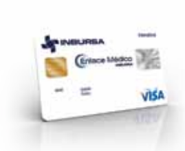
Nota Inbursa Óptimo para Médicos titulados con Cédula Profesional

Tú, tu cónyuge e hijos menores de 23 años están cubiertos en caso de pérdidas corporales o muerte accidental durante tus viajes en un medio de transporte público autorizado, pagando el 100% del boleto de transporte con tu Tarjeta de Crédito Enlace Médico Inbursa. Aplica hasta por $250,000 USD.